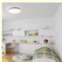
LEDシーリングライト 目覚めのあかり