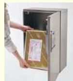
戸建住宅用宅配ボックス COMBO (コンボ)