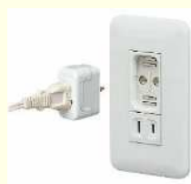
配線器具 マグネットコンセント