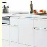
ビルトイン食器洗い乾燥機